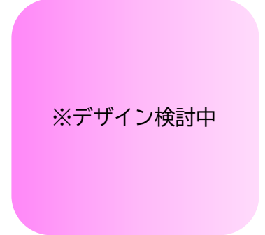
「メッシュで作るバッグ」