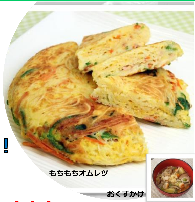
もちもちオムレツ