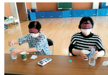
出前教室(キャップハンディ体験)

「センターまつり」「ダンスイベント」「カルチャー＆スポーツ教室」とびっきりのワクワクをあなたに!!