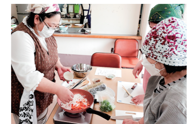
趣味の教室(クッキング教室)