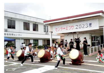
センターまつり! 8月の最終日曜日に開催!