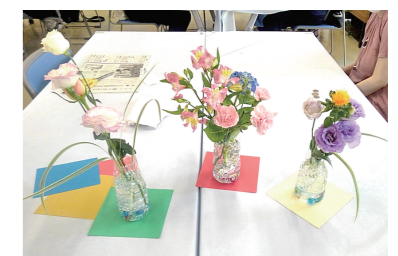
盆前&フラワーアレンジメント教室