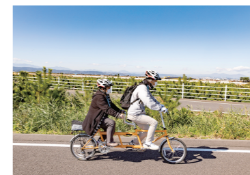
パラスポ体験(タンデム試乗体験会)