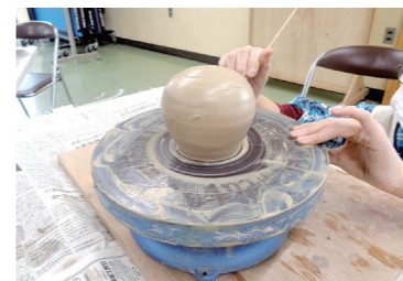
趣味の教室(陶芸教室)