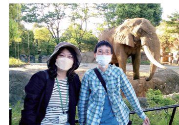
チャレンジトレーニング(外出訓練)